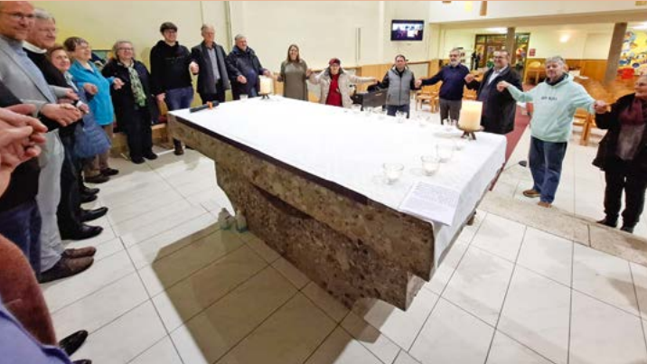
Feier mit Christ:innen anderer Traditionen

Silvester-Andacht: Jede Kerze steht für Dankbarkeit oder auch einen Wunsch aus der Gemeinschaft der Feiernden