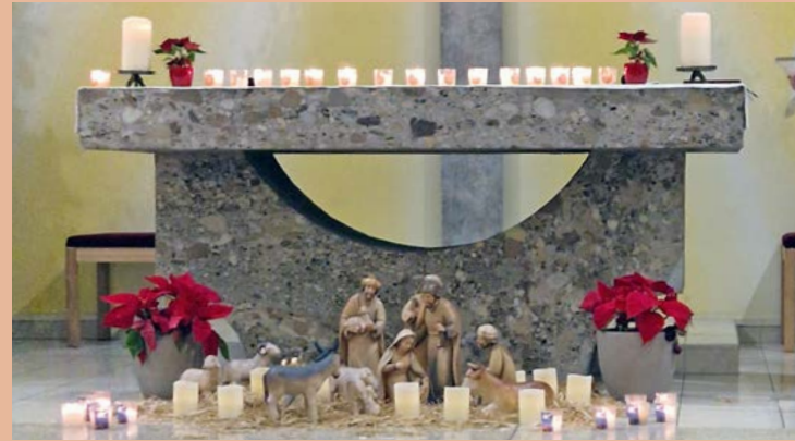
Adventlesung in der Kirche - eine Reise zu Besinnlichem und Humorvollem

Silvester-Andacht: Jede Kerze steht für Dankbarkeit oder auch einen Wunsch aus der Gemeinschaft der Feiernden